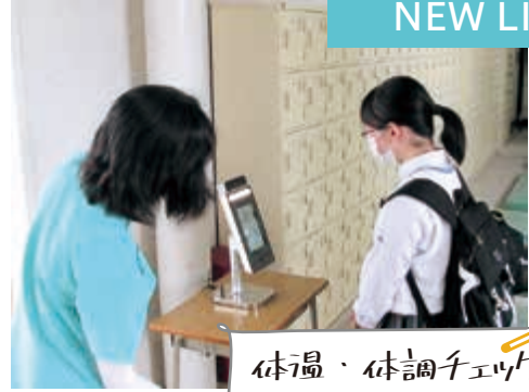
体温・体調チェック