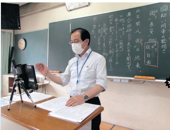
△ 6年生は大学入試対策問題に取り組む