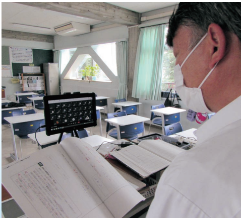
△ オンラインでも対話を重視し授業展開