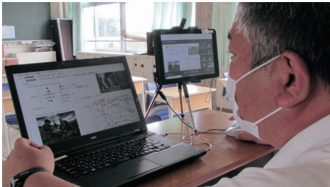
△ 地理・地図や写真の活用はスライドで

オンライン授業は昨年の非常事態宣言から始まり、既に数回、実施を余儀なくされた。効果的にICT機器を活用するため教員も自ら勉強会に参加したり、互いに教えあったりと技術面でのスキルアップを図り、対面授業に劣らないよう努めている。今回はその様子の一部をレポートした。